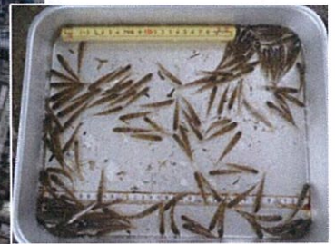
お魚たくさんとれるかな