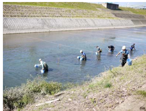
採取員のリリース