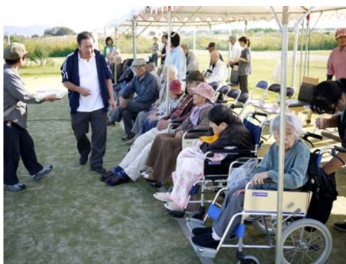
周辺施設からの参加者たち