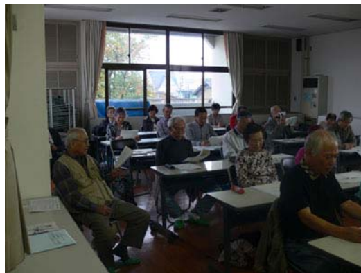
講師のお話熱心に聞き入る参加者