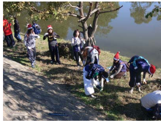
学生によるワンド付近のゴミ積収集状況(2)