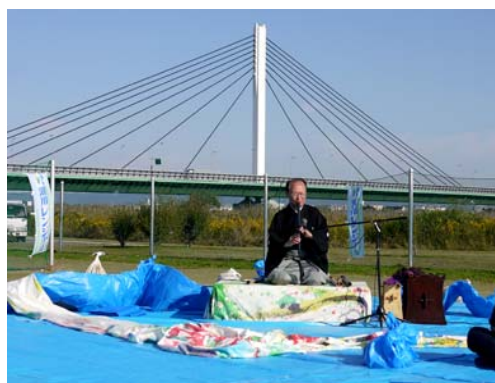
鳥飼仁和寺大橋を背景にした舞台設定