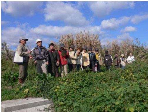
・ポイント②鵜殿ヨシ原に生息するヨシ・オギのお話