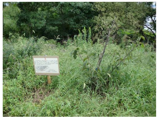
不法耕作に対する指導の状況(10/2)