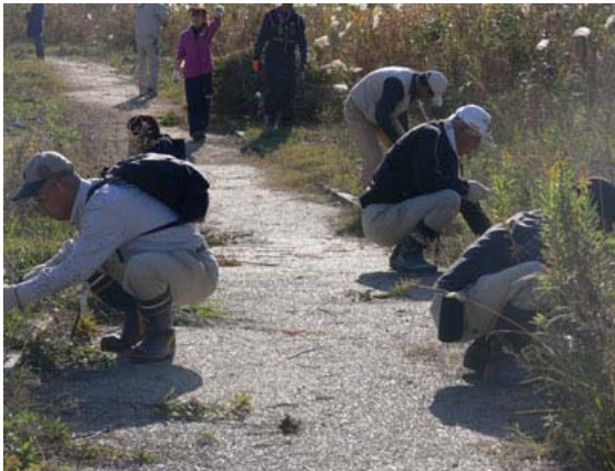
一般参加者による草刈り風景