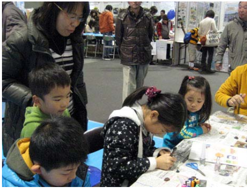
工作体験（オニグルミストラップ）