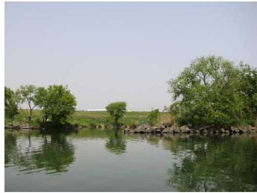
ボートより河川敷・水際の状況を調査 (5/4)