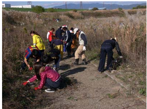
学生による三島江切り下げ部園路の草刈り風景