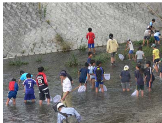
川に入って魚取りを楽しむ子供達