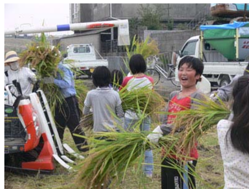
満面の笑みで楽しむ児童達