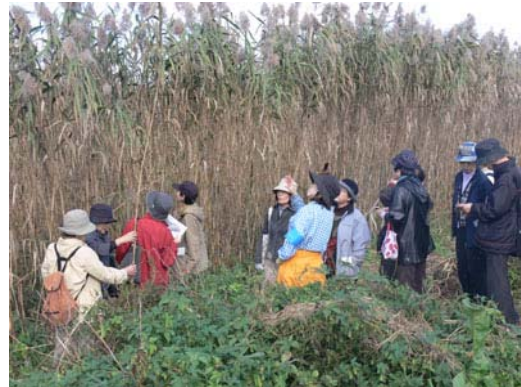
・ポイント③ヨシとオギの観察