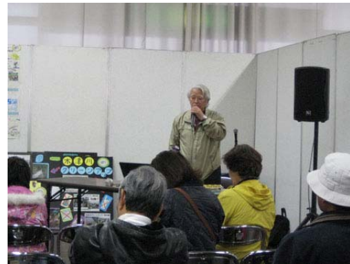
「NPO 法人やましる里山の会及び木津川について」山村河川レンジャー