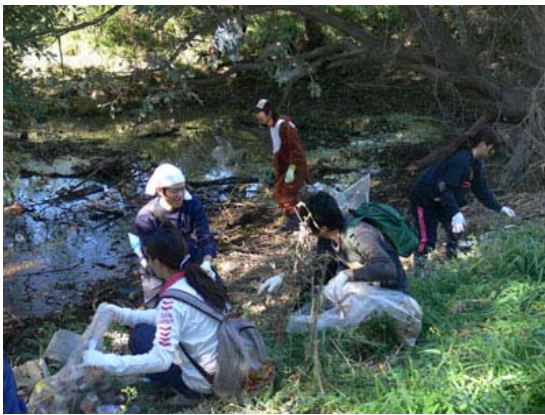
学生によるワンド付近のゴミ積収集状況(1)