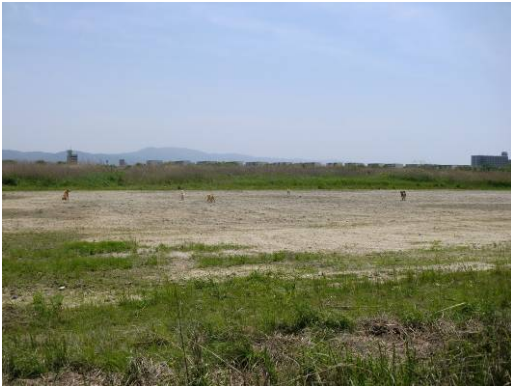
野犬 5 匹に遭遇 (5/14)