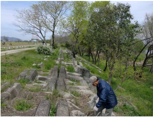
草刈り・清掃を行うボランティア (4/17)