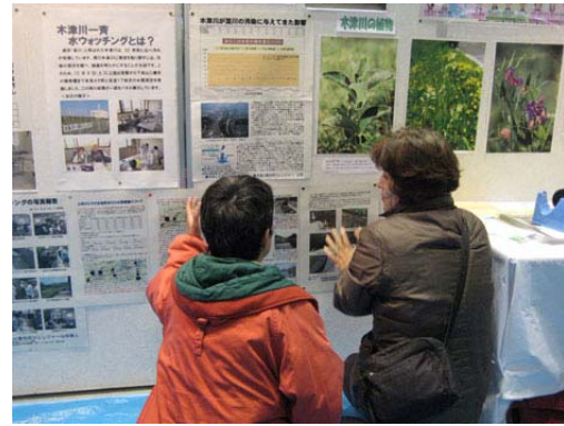
レンジャーによる展示パネルの解説