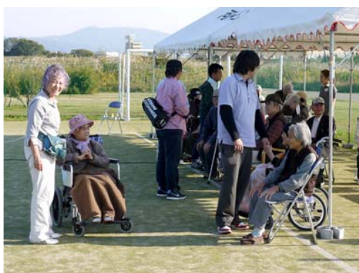
満足した笑顔で散会