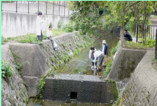
名木川で水質調査中の広野中科学クラブ