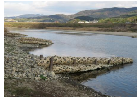
竹蛇籠 玉水橋約 1km 下流