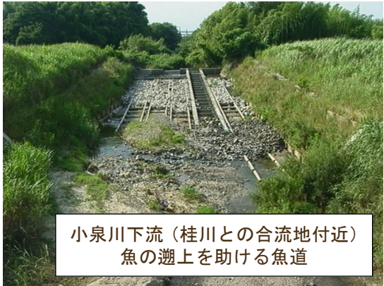
小泉川下流（桂川との合流地付近） 魚の遡上を助ける魚道