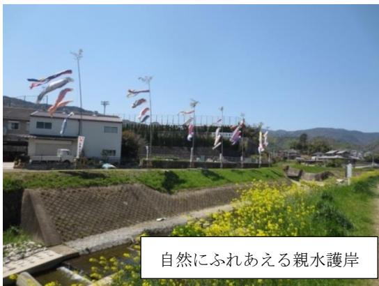
自然にふれあえる親水護岸

小泉川は、街中を流れていながら水はきれいで、多くの水生生物が棲んでいます。桂川の合流地付近まで、歩きながら、護岸のようすや、川辺の植物や川に生息する生きものを、いっしょに観察しませんか。